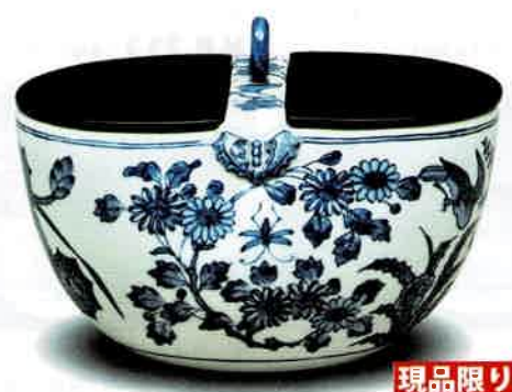
0-303 (Size:24×19.5×H17cm) 釣瓶水指 祥瑞 林淡幽作 (桐箱) 定価¥528,000→ 特価¥264,000 (本体¥240,000)