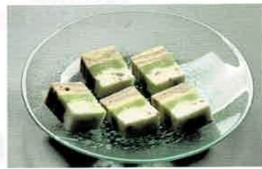
1-314 涼風皿 義山 (φ24×H4 cm) (紙箱) 特価 ¥3,300 (本体 ¥3,000)