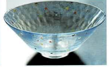
1-305 平茶盤 義山 星空 (超耐熱) (φ15×H6 cm) 水出宋絢作 (化粧箱) ¥8,712 (本体 ¥7,920)