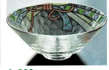
1-309 平茶盤 義山 束のし (超耐熱) (φ15×H6 cm) 山岡善高作 (化粧箱) ¥9,196 (本体 ¥8,360)