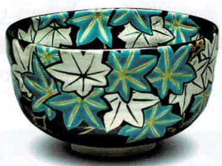
0-302 茶碗 黒仁清 青楓 加藤如水作 (桐箱) ¥33,880 (本体¥30,800)