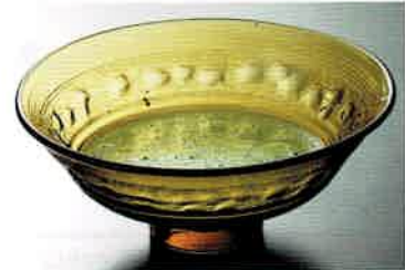
1-312 平茶盤 義山 琥珀 (超耐熱) (φ14.8×H5.8 cm) 長寿作 (化粧箱) ¥6,050 (本体 ¥5,500)