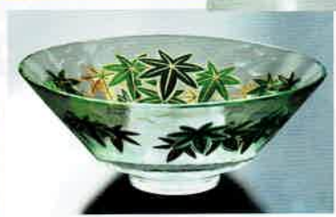
1-301 平茶盤 義山 青楓 (超耐熱) (φ15×H6 cm) 東太武朗作 (化粧箱) ¥7,260 (本体 ¥6,600)