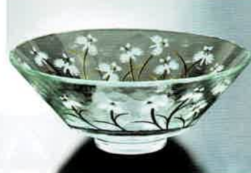
1-302 平茶盤 義山 鷺草 (超耐熱) (φ15×H6 cm) 東太武朗作 (化粧箱) ¥7,260 (本体 ¥6,600)