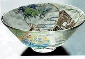
1-310 平茶盤 義山 団扇に夏模様 (超耐熱) (φ15×H6 cm) 水出宋絢作 (化粧箱) ¥8,712 (本体 ¥7,920)