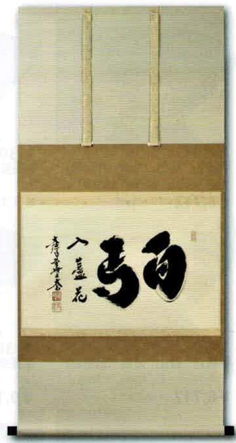
0-301 軸 横物「白馬入蘆花」 大徳寺 黄梅院 小林太玄師 (桐箱) ¥83,490 (本体¥75,900)