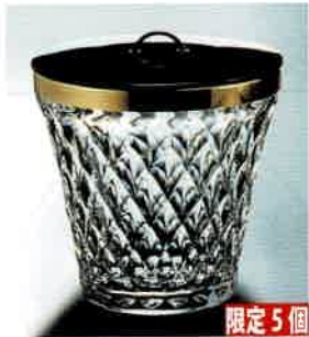
1-316 クリスタル 末広水指 (φ16×H18.5 cm) 大中繁明作 (桐箱) ¥49,610 (本体 ¥45,100)