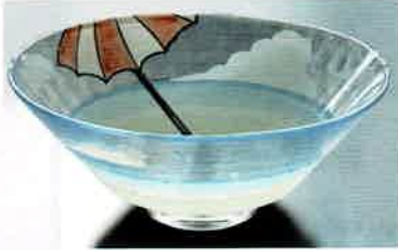
1-307 平茶盤 義山 夏空 (超耐熱) (φ15×H6 cm) 山岡善高作 (化粧箱) ¥9,196 (本体 ¥8,360)