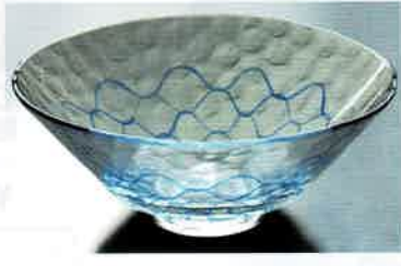
1-311 平茶盤 義山 青網 (超耐熱) (φ15×H6 cm) 清水北斗作 (化粧箱) ¥9,196 (本体 ¥8,360)