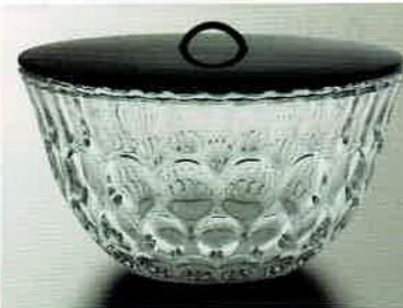
1-321 義山平水指 水玉 (菓子器にも使えます) (φ22.6×H14 cm) 長寿作 (化粧箱) ¥22,990 (本体 ¥20,900)