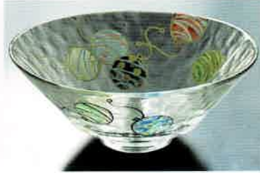
1-303 平茶盤 義山 水風船 (超耐熱) (φ15×H6 cm) 山岡善高作 (化粧箱) ¥9,196 (本体 ¥8,360)