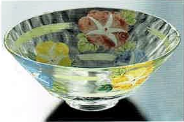
1-304 平茶盤 義山 朝顔 (超耐熱) (φ15×H6 cm) 水出宋絢作 (化粧箱) ¥8,712 (本体 ¥7,920)