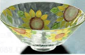
1-306 平茶盤 義山 向日葵 (超耐熱) (φ15×H6 cm) 水出宋絢作 (化粧箱) ¥8,712 (本体 ¥7,920)