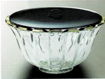
1-320 末広金縁水指 (φ24.5×H16 cm) 長寿作 (化粧箱) ¥23,760 (本体 ¥21,600)