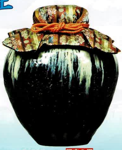
0-305 限定2個 飾壺 朝鮮唐津 (Size:22.3×H27cm) (正絹網・正絹口覆・正絹三本紐付) 鶴田純久作 (桐箱) 定価¥308,000→ 特価¥154,000 (本体¥140,000)