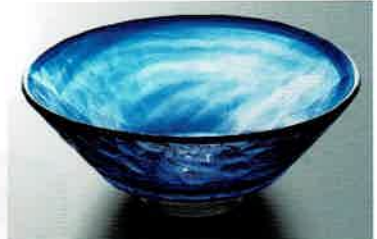
1-313 平茶盤 義山 瑠璃 (超耐熱) (φ15×H6 cm) 東太武朗作 (化粧箱) ¥6,050 (本体 ¥5,500)