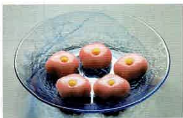
1-315 薄氷皿 義山 (φ23×H4 cm) (紙箱) ¥1,452 (本体 ¥1,320)