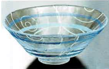
1-308 平茶盤 義山 波紋 (超耐熱) (φ15×H6 cm) 水出宋絢作 (化粧箱) ¥8,712 (本体 ¥7,920)