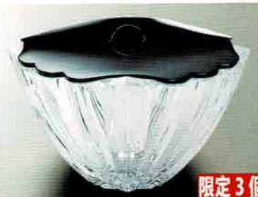
1-322 クリスタルカットグラス水指 輪島塗錆色仕上げ塗蓋 (φ25×H16 cm) フランス製 (桐箱) ¥107,250 (本体 ¥97,500)