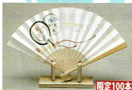
6-213 五寸扇子 白竹 団扇の絵 (化粧箱) ¥831 (本体¥770)