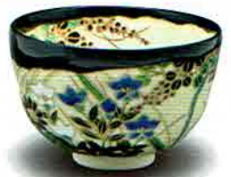
7-205 茶盃 掛分 秋草 伊坂清香作(桐箱) ¥17,172 (本体¥15,900)