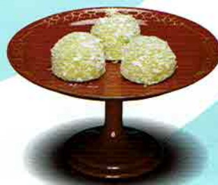
5-216 高杯 朱唐草 （φ18×H10cm）（化粧箱） ¥8,434（本体¥7,810）