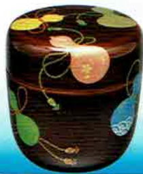
4-210 中棗 溜 六瓢時絵 中村湖彩作 (桐箱) ¥22,896 (本体 ¥21,200)