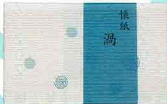
6-203 懐紙 渦 1帖入 こころ懐紙本舗 ¥273 (本体¥253)