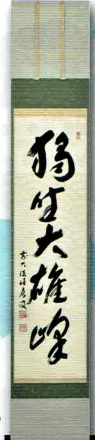
5-203 軸 一行物「独坐大雄峰」 大徳寺派 招春寺（京都府南丹市）福本積應師賛（桐箱） ¥48,708（本体¥45,100）