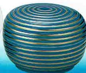
4-221 食籠 浅黄交趾 千筋 (21×14cm) 御室窯 (桐箱) ¥71,280 (本体 ¥66,000)