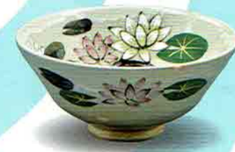
5-211 平茶盃 御本 水蓮 中村与平作（化粧箱） ¥7,700（本体¥7,130）