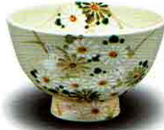
7-210 茶盃 御本 白菊に兎 水出宋絢作(化粧箱) ¥7,959 (本体¥7,370)