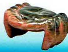
4-202 蓋置 赤楽 蟹 川崎和楽作 (桐箱) ¥10,908 (本体 ¥10,100)

本物の糸を巻いてあります。 緑：彗星 白：天の川 ピンク：織姫 モイメージしてあります。