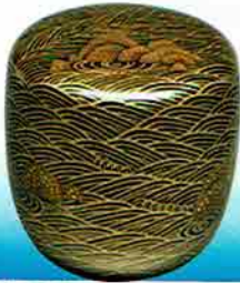
4-211 中棗 岩波時絵 塚本規義作 (桐箱) ¥79,920 (本体 ¥74,000)