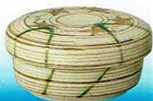
4-220 食籠 木瓜 織部 小 (19×16.5×11cm) 加藤五陶作 (紙箱) ¥4,989 (本体 ¥4,620)