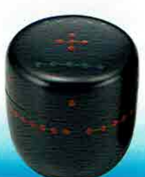
4-208 亀蔵棗 一閑 圓能斎好写 中村宗悦作 (桐箱) ¥29,484 (本体 ¥27,300)