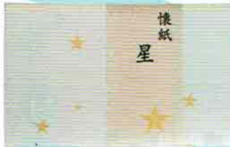
6-204 懐紙 星 1帖入 こころ懐紙本舗 ¥273 (本体¥253)