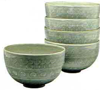
4-213 数茶盃 七宝三島 5客入 治兵衛窯 (紙箱) ¥22,572 (本体 ¥20,900)