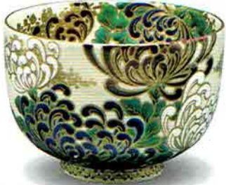
5-205 茶盃 仁清 菊盛 清閑寺窯（桐箱） ¥118,800（本体¥110,000）