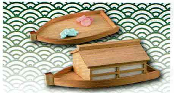
4-205 杉干菓子器 屋形船 (化粧箱) ¥10,692 (本体 ¥9,900)