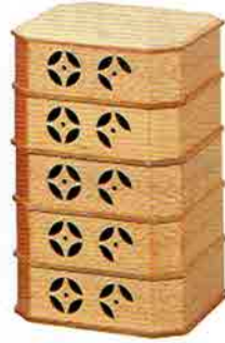
4-206 縁高重 生地 七宝透 李仙作 (化粧箱) ¥27,324 (本体 ¥25,300)