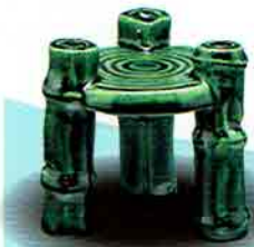
5-213 蓋置 鼎 (かなえ) 佐々木昭楽作（桐箱） ¥9,504（本体¥8,800）