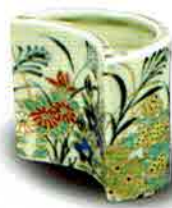
7-217 蓋置 色絵 秋月 高野昭阿弥作(木箱) ¥9,979 (本体¥9,240)