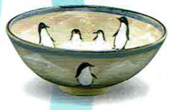
5-210 平茶盃 乾山 ペンギン 中村与平作（化粧箱） ¥8,672（本体¥8,030）