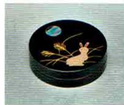
7-214 香合 月に兎蒔絵 中村宗悦作(桐箱) ¥14,904 (本体¥13,800)