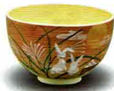
7-208 茶盃 掛分 月見兎 水出宋絢作(化粧箱) ¥6,890 (本体¥6,380)