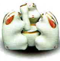
7-218 蓋置 色絵 三ツ兎 高野昭阿弥作(木箱) ¥8,316 (本体¥7,700)