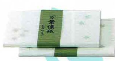
6-201 万葉懐紙 あおかえで 2帖入 こころ懐紙本舗 ¥439 (本体¥407)