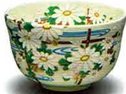
7-212 茶盃 御本 白菊 宮地英香作(化粧箱) ¥5,227 (本体¥4,840)