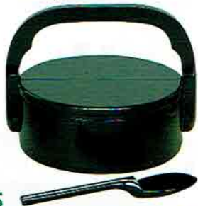
4-215 黒真塗 手付飯器 利休好写 (杓子別売) (化粧箱) ¥89,100 (本体 ¥82,500)