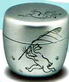
6-216 中棗 銀地 鳥獸戯画 樹脂製 (化粧箱) ¥3,326 (本体¥3,080)