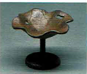
5-218 鉄蓋置 蓮葉 般若勘溪作（桐箱） ¥26,784（本体¥24,800）