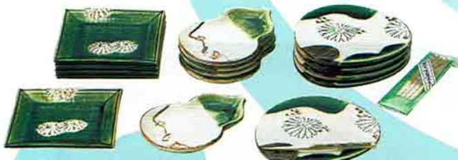
6-221 銘々皿 織部 団扇 (黒文字付) (紙箱) 加藤五陶作 ¥4,428 (本体¥4,100)