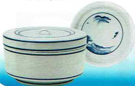
4-222 食籠 染付山水 惺斎好写 (20×12cm) 御室窯 (桐箱) ¥54,000 (本体 ¥50,000)