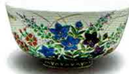
7-206 茶盃 白釉 秋草 山岡善高作(桐箱) ¥18,576 (本体¥17,200)