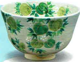
5-209 茶盃 乾山 風船かずら 田中香泉作（化粧箱） ¥6,253（本体¥5,790）