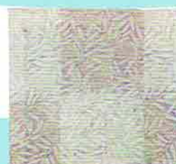
6-219 古帛紗 紗市松ボカシ 桔梗 正絹 西陣織 (化粧箱) ¥3,780 (本体¥3,500)