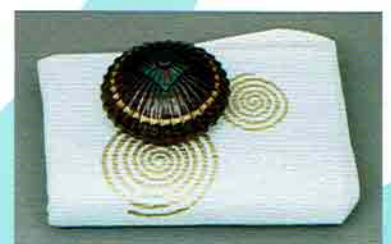
5-214 唐傘香合 櫻摺漆 中村宗悦作 （化粧箱） ¥28,296（本体¥26,200）