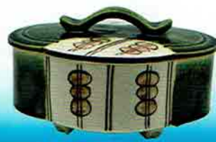
4-219 食籠 木瓜 織部 大 (22×20×13cm) 加藤五陶作 (紙箱) ¥8,553 (本体 ¥7,920)