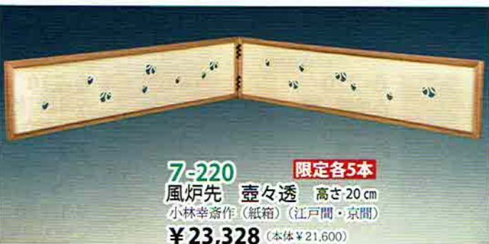
7-220 風炉先 壺々透 高さ20cm 小林幸彦作(紙箱)(江戸間・京間) 限定各5本 ¥23,328 (本体¥21,600)