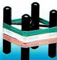
4-203 蓋置 糸巻三色 金谷浄雲作 (桐箱) ¥26,676 (本体 ¥24,700)

本物の糸を巻いてあります。 緑：彗星 白：天の川 ピンク：織姫 モイメージしてあります。