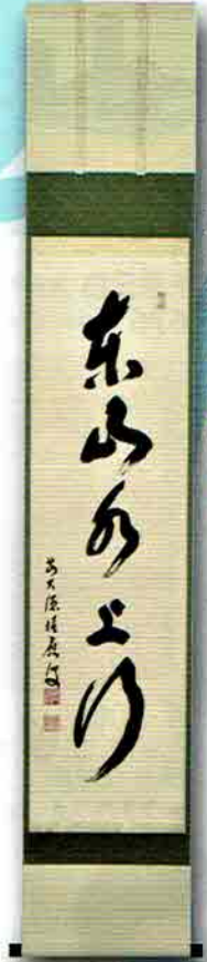
5-202 軸 一行物「東山水上行」 大徳寺派 招春寺（京都府南丹市）福本積應師賛（桐箱） ¥48,708（本体¥45,100）