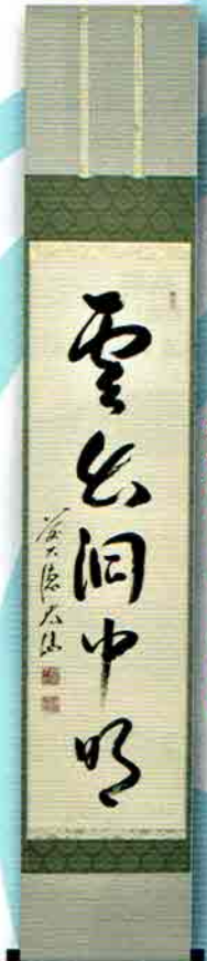
5-201 軸 一行物「雲出洞中明」 限定5本 大徳寺派 観音寺（福岡県芦屋町）野村太仙師（桐箱） 定価¥59,660↓特價¥32,400