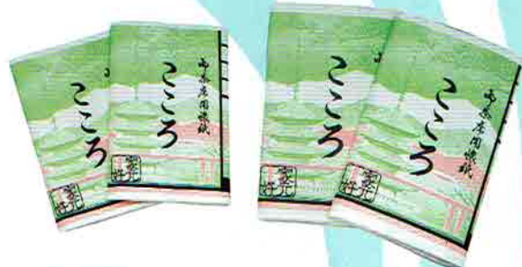
6-207 こころ懐紙 男子用 2帖入 (片面ラミネート加工) こころ懐紙本舗 ¥641 (本体¥594)