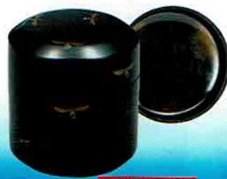
4-209 限定10個 大雪吹茶器 早苗莖時絵 即中斎好写 塚本規義作 (桐箱) ¥46,116 (本体 ¥42,700)