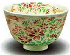
7-209 茶盃 御本 秋桜 田中香泉作(化粧箱) ¥6,253 (本体¥5,790)