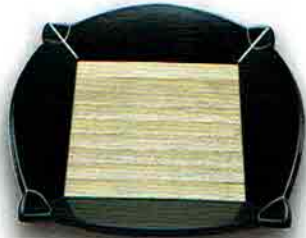
4-207 七宝盆 鵬雲斎好写 中村宗悦作 (桐箱) ¥28,512 (本体 ¥26,400)