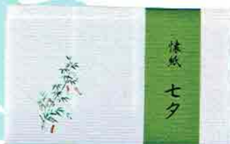
6-202 懐紙 七夕 1帖入 こころ懐紙本舗 ¥273 (本体¥253)