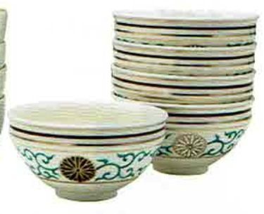
4-212 数茶盃 天目形 菊唐草 10客入 田中香泉作 (桐箱) ¥61,236 (本体 ¥56,700)