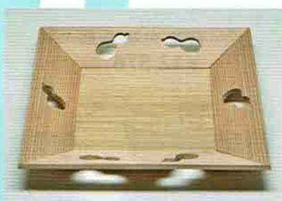
6-212 杉四方盆 瓢透し (化粧箱) ¥4,276 (本体¥3,960)