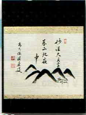
5-204 軸 横物「妙法大文字東山北嶺中」 大徳寺派 招春寺（京都府南丹市）福本積應師賛 （桐箱） ¥55,620（本体¥51,500）