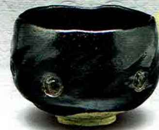
7-207 茶盃 了入写 湖月 佐々木昭楽作(桐箱) ¥35,208 (本体¥32,600)

黒茶碗 湖月 了入写 全体にやや厚地りて、大胆な強い線を斜めにはしらせながら力強くまとま上りていっている。高台は大きく土見せになっており、小さく味わいある高台が削り出されてあり、蓋付きは一か所削られていて、割口に了入の隠扉印が捺されている。又、脚部と見込みに九つの隠扉印と高台脇に「飯土老人」の印が捺されている。 晩年の了入を代表する秀作である。