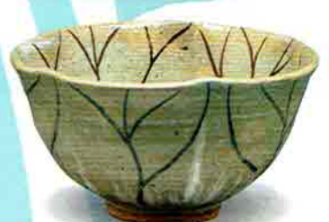
5-206 茶盃 灰釉 蓮 中村良三作（桐箱） ¥19,980（本体¥18,500）