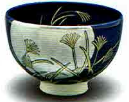
7-213 茶盃 瑠璃釉 月に芒 見谷福峰作(化粧箱) ¥6,890 (本体¥6,380)