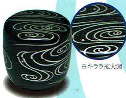
6-218 中棗 キラ黒塗 銀流水絵 樹脂製 (化粧箱) ¥3,920 (本体¥3,630)