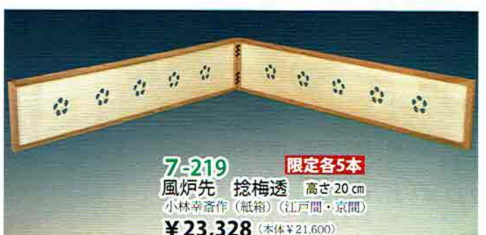
7-219 風炉先 掬梅透 高さ20cm 小林幸彦作(紙箱)(江戸間・京間) 限定各5本 ¥23,328 (本体¥21,600)