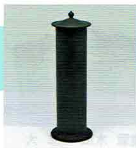
5-217 唐銅経筒花入 金谷浄雲作（桐箱） ¥25,704（本体¥23,800）