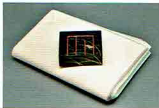
7-215 香合 源氏香図 鈴虫 中村湖彩作(化粧箱) ¥18,360 (本体¥17,000)