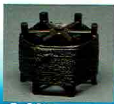
4-204 唐銅蓋置 糸巻 般若勘溪作 (桐箱) ¥33,264 (本体 ¥30,800)