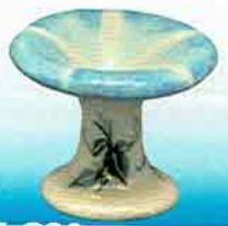
4-201 蓋置 朝顔 吉村楽入作 (桐箱) ¥11,880 (本体 ¥11,000)