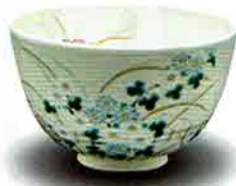
7-211 茶盃 御本 小菊 見谷福峰作(化粧箱) ¥5,464 (本体¥5,060)