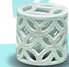
5-212 蓋置 白磁 七宝透 横石嘉助作（桐箱） ¥9,504（本体¥8,800）