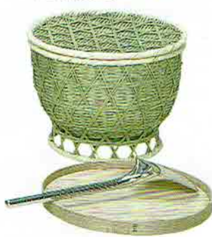
4-214 竹飯器セット (曲給仕盆・銀色杓子付) (紙箱) ¥51,192 (本体 ¥47,400)