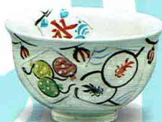
5-207 茶盃 粉引 緑日 中村与平作（化粧箱） ¥7,700（本体¥7,130）