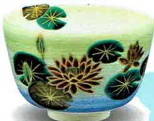
5-208 茶盃 モネ水蓮 中村与平作（化粧箱） ¥8,672（本体¥8,030）