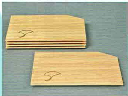
6-206 杉銘々皿 銀杏 5枚組 (化粧箱) ¥3,855 (本体¥3,570)