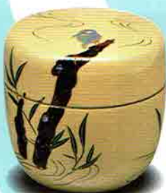
6-217 中棗 白漆 翡翠 木質 (化粧箱) ¥9,028 (本体¥8,360)