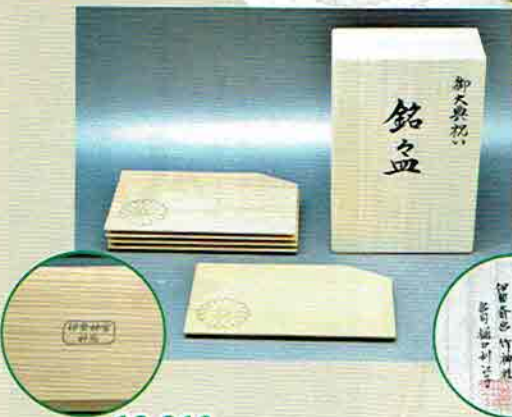
18-210 銘々皿 御大典記念 伊勢神宮杉古材以造 伊勢 齋宮 竹神社宮司 樋口利江子氏書付 (桐箱) ¥19,440 (本体¥18,000)