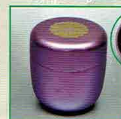
19-213 中棗 紫菊 (蓋裏：鳳凰) 中村湖彩作 (桐箱) ¥21,384 (本体¥19,800)