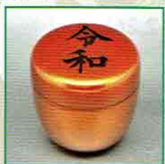
19-209 中棗 朱金「令和」 樹脂製 (プラスチックケース) ¥5,940 (本体¥5,500)