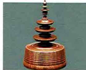
夏特選 -27 限定3個 紫檀香合 三重塔 福田芳朗作 (桐箱) 定価 ¥154,000→ 特價 ¥84,240