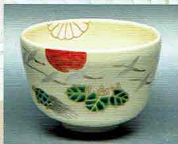
19-207 茶碗 仁清 鶴亀菊桐 中村与平作 (化粧箱) ¥8,316 (本体¥7,700)