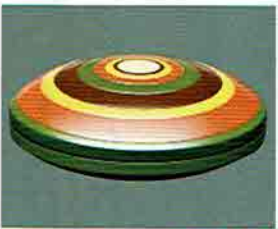
夏特選 -30 限定5個 香合 独楽塗 角出俊平作 (桐箱) 定価 ¥70,100→ 特價 ¥45,360