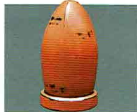
夏特選 -32 現品限り 根来塗煙草入 椰子の美型 松通作 (桐箱) 定価 ¥138,600→ 特價 ¥63,720