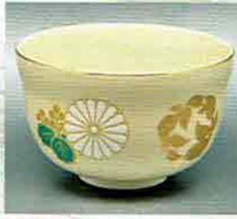
18-206 茶盃 仁清 梓 御大典記念 宮地英香作 (化粧箱) ¥4,752 (本体¥4,400)