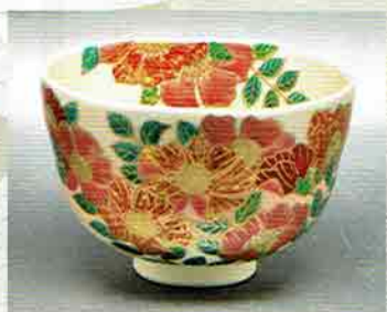
19-205 茶碗 御本 ハマナス 伊坂清香作 (化粧箱) ¥11,232 (本体¥10,400)