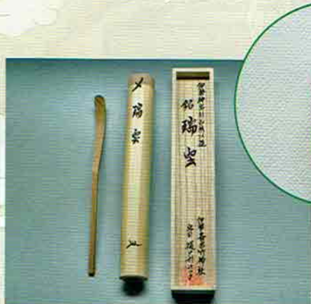
18-211 銘入茶杓 銘「瑞雲」 御大典記念 伊勢神宮杉古材以造 伊勢 齋宮 竹神社宮司 樋口利江子氏書付 (桐箱) ¥33,480 (本体¥31,000)