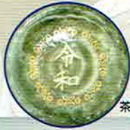
18-207 茶盃 緑伊羅保 内「令和」 豊窯 (化粧箱) ¥2,268 (本体¥2,100)