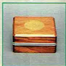
19-215 香合 錫縁 菊 中村宗悦作 (桐箱) ¥14,256 (本体¥13,200)