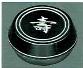
夏特選 -28 限定4個 香合 青貝 寿の字 愷齋好写 中村宗悦作 (桐箱) 定価 ¥56,100→ 特價 ¥36,720