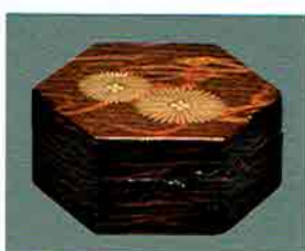
夏特選 -35 限定10個 松皮六角香合 唐松 (化粧箱) 定価 ¥10,044→ 特價 ¥7,030