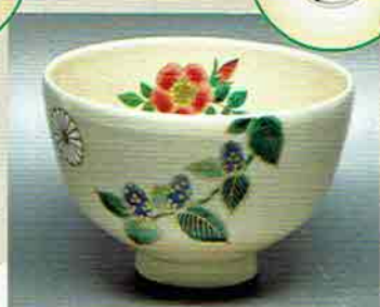
19-202 茶碗 御本「令和」梓にハマナス 巖窯 (桐箱) ¥12,636 (本体¥11,700)