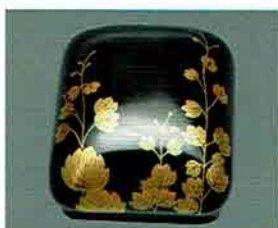
夏特選 -23 限定2個 琳派香合 蕙時絵 峰春作 (桐箱) 定価 ¥89,100→ 特價 ¥37,800