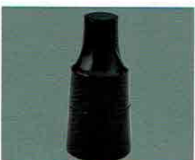
夏特選 -42 限定5個 杵香合 一燈好写 中村宗悦作 (桐箱) 定価 ¥21,060→ 特價 ¥14,700