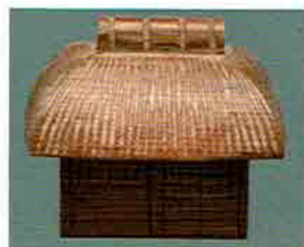
夏特選 -43 限定5個 葛屋香合 一位木 公之作 (化粧箱) 定価 ¥17,064→ 特價 ¥11,900