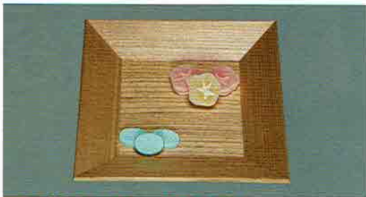
夏特選 -34 限定20枚 四方干菓子器 桐上 柁目 本金箔散らし クリアー加工 雄齋作 (桐箱) 定価 ¥16,000→ 特價 ¥9,100