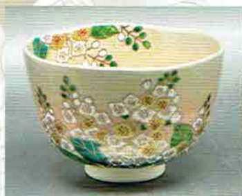
19-206 茶碗 御本 梓 伊坂清香作 (化粧箱) ¥11,232 (本体¥10,400)