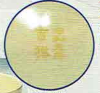
18-205 茶盃 仁清 万葉集 内「令和元年 吉祥」 宮地英香作 (化粧箱) ¥4,050 (本体¥3,750)