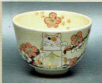
19-204 茶碗 仁清「令和」招き猫 水出宋絢作 (化粧箱) ¥7,128 (本体¥6,600)

軸 一行物 「嘉辰令月」 大徳寺 黄梅院主 小林太玄師 (桐箱) ¥78,408 (本体¥72,600)