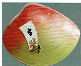
夏特選 -41 限定5個 蛤香合 宝船画 中村湖彩作 (桐箱) 定価 ¥29,800→ 特價 ¥16,500