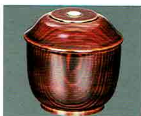
夏特選 -31 限定5個 松ノ木香合 不見齋好写 中村湖彩作 (桐箱) 定価 ¥22,000→ 特價 ¥13,100