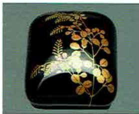
夏特選 -25 限定6個 琳派香合 萩時絵 峰春作 (桐箱) 定価 ¥89,100→ 特價 ¥37,800