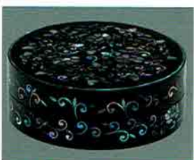
夏特選 -37 限定5個 琉球青貝香合 宗旦好写 中村宗悦作 (桐箱) 定価 ¥81,540→ 特價 ¥57,000