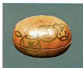
夏特選 -21 限定5個 香合 乾漆 唐瓢 又鈔齋好写 畦地粒依作 (桐箱) 定価 ¥64,900→ 特價 ¥42,120