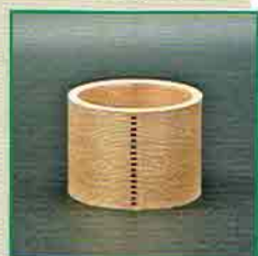
19-212 限定10個 曲蓋置 高木又三作 (桐箱) ¥21,600 (本体¥20,000)