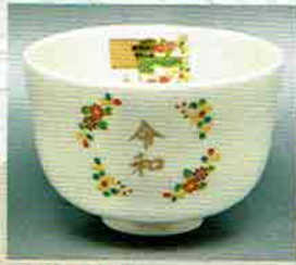
18-208 茶盃 花丸「令和」 花月窯 (化粧箱) ¥3,834 (本体¥3,550)