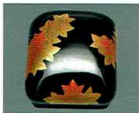
夏特選 -24 現品限り 琳派香合 紅葉時絵 峰春作 (桐箱) 定価 ¥89,100→ 特價 ¥57,240