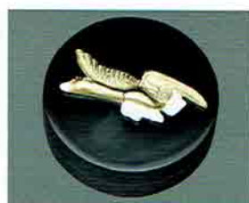
夏特選 -22 限定5個 香合 雁 即中齋好写 中村宗悦作 (桐箱) 定価 ¥66,000→ 特價 ¥35,000