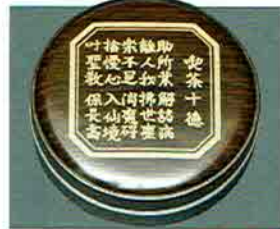
夏特選 -29 限定5個 香合 喫茶十徳 井伊宗観好写 川上浩峰作 (桐箱) 定価 ¥63,800→ 特價 ¥41,040