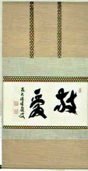
18-202 軸横物 「敬愛」 大徳寺派 招春寺 (京都府南丹市) 福本稔應師賛 (桐箱) ¥54,648 (本体¥50,600)