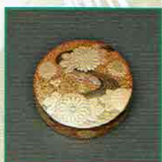
19-210 現品限り 香合 菊水時絵 中村孝也作 (桐箱) ¥132,000 (本体¥122,223)