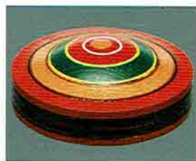
夏特選 -38 限定10個 香合 唐人笠 独楽塗 (化粧箱) 定価 ¥8,208→ 特價 ¥5,740