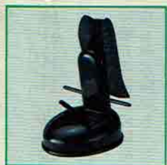
19-216 冠香合 一閑張 鵬雲斎好写 宗之作 (桐箱) ¥43,956 (本体¥40,700)