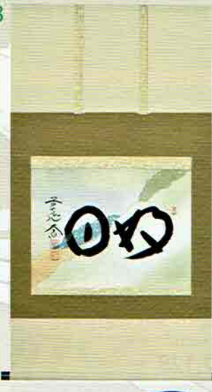
18-201 軸横物 「好日」継ぎ紙 限定5枚 大徳寺派 極楽寺 (兵庫県城崎町) 西垣大道師賛 (桐箱) 定価¥59,400 ↓ 特価 ¥29,800