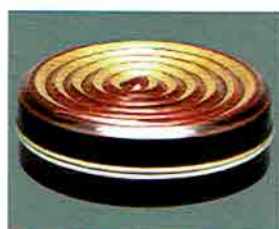
夏特選 -36 限定5個 香合 渦 淡々齋好写 塚本規義作 (桐箱) 定価 ¥23,760→ 特價 ¥16,600