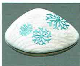
夏特選 -26 限定4個 桐木地 蛤香合 海松時絵 淡々齋好写 村田宗悦作 (桐箱) 定価 ¥49,100→ 特價 ¥31,320