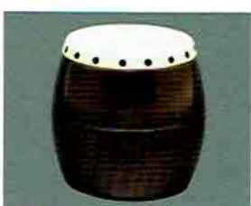
夏特選 -40 限定5個 太鼓形香合 (化粧箱) 定価 ¥9,288→ 特價 ¥6,500