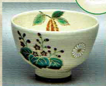
19-203 茶碗 御本「平成」桐に白樺 巖窯 (桐箱) ¥12,636 (本体¥11,700)