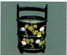
夏特選 -44 限定5個 香合 手桶形 朝顔 塚本規義作 (桐箱) 定価 ¥14,256→ 特價 ¥9,970