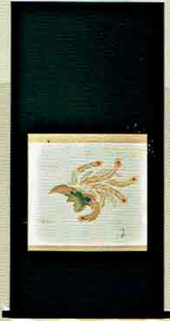
18-204 軸 鳳凰 曾根幸風画 (化粧箱) ¥20,196 (本体¥18,700)