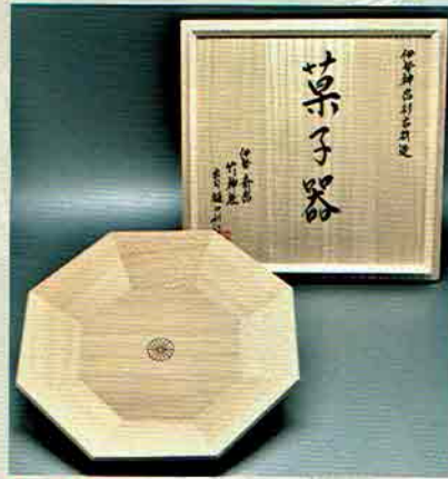
18-209 八角菓子器 御大典記念 伊勢神宮杉古材以造 伊勢 齋宮 竹神社宮司 樋口利江子氏書付 (桐箱) ¥43,200 (本体¥40,000)