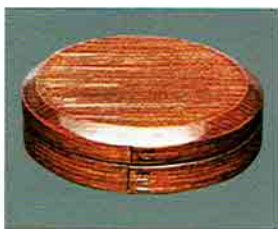
夏特選 -33 限定5個 曲香合 溜塗へギ 中村宗悦作 (桐箱) 定価 ¥28,600→ 特價 ¥14,040