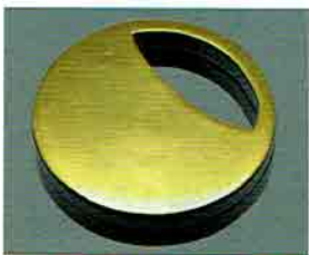
夏特選 -39 限定5個 壺々香合 中村湖彩作 (化粧箱) 定価 ¥15,400→ 特價 ¥9,700