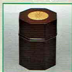
19-214 八角茶器 一閑 溜 菊 海田雅孝作 (桐箱) ¥24,948 (本体¥23,100)